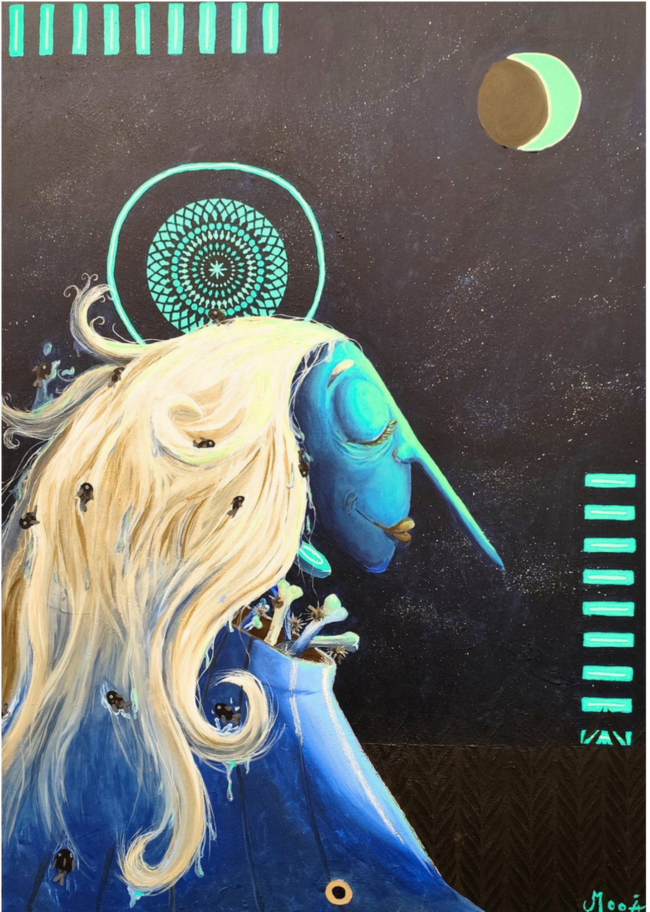
Acceptation lunaire, 2025 Acrylique sur toile, 92 x 65 cm