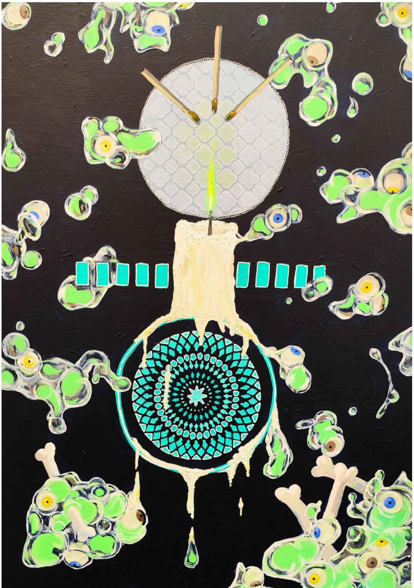
Les aveugles , 2026 Acrylique sur toile, 65 x 56 cm