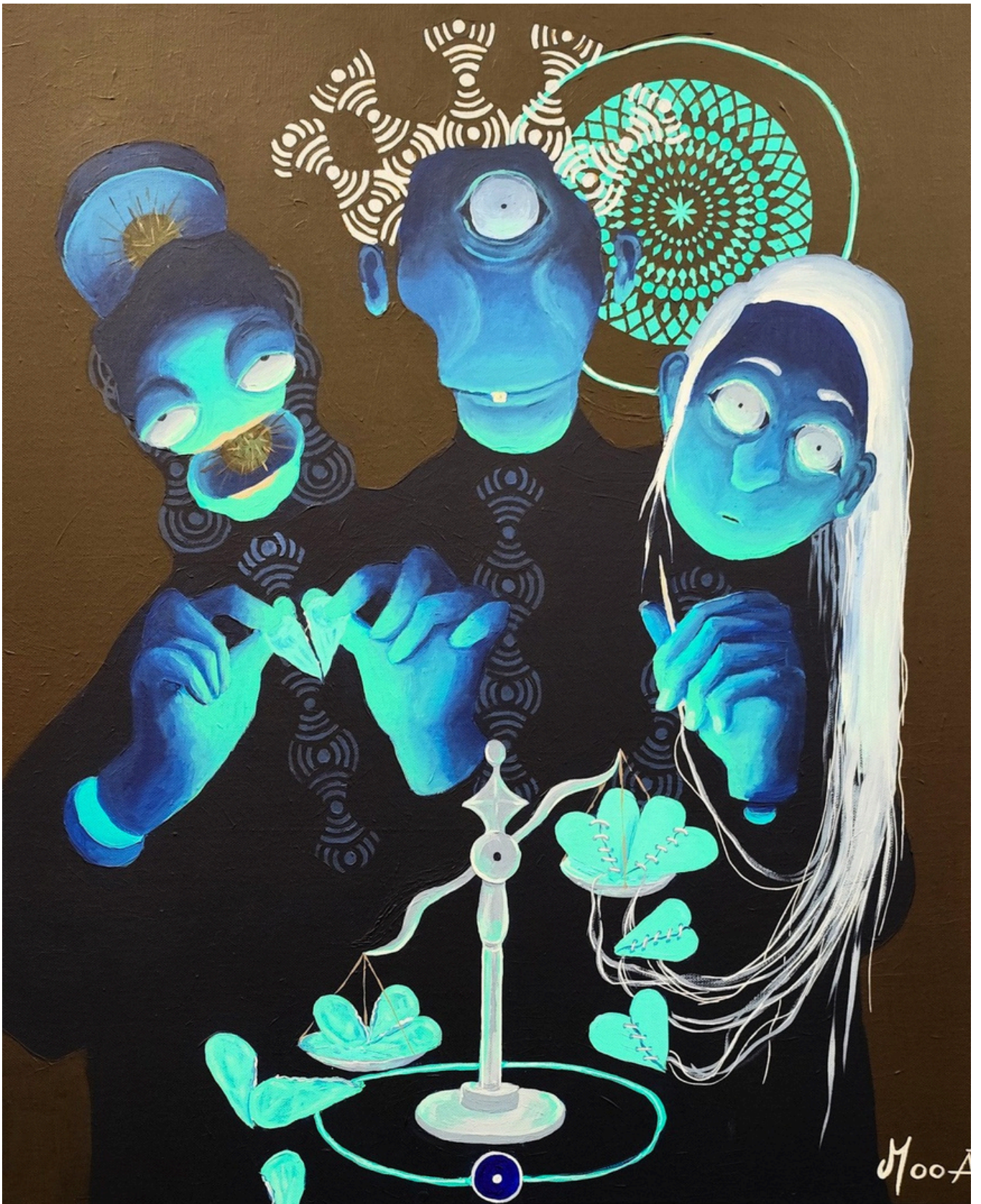
Grandir , 2025 Acrylique sur toile, 65 × 56 cm