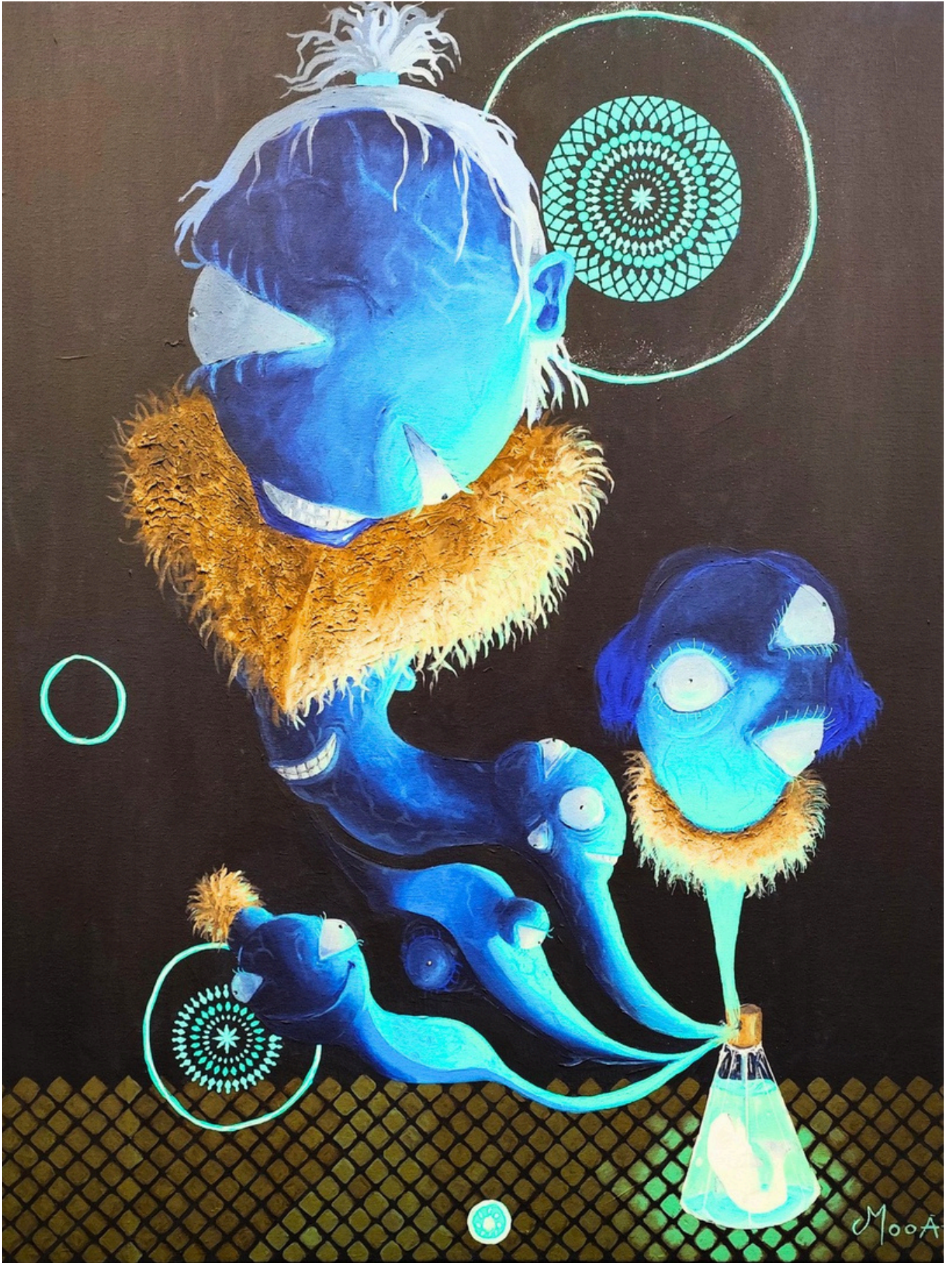
Beauté antérieure, 2025 Acrylique sur toile, 65 × 56 cm