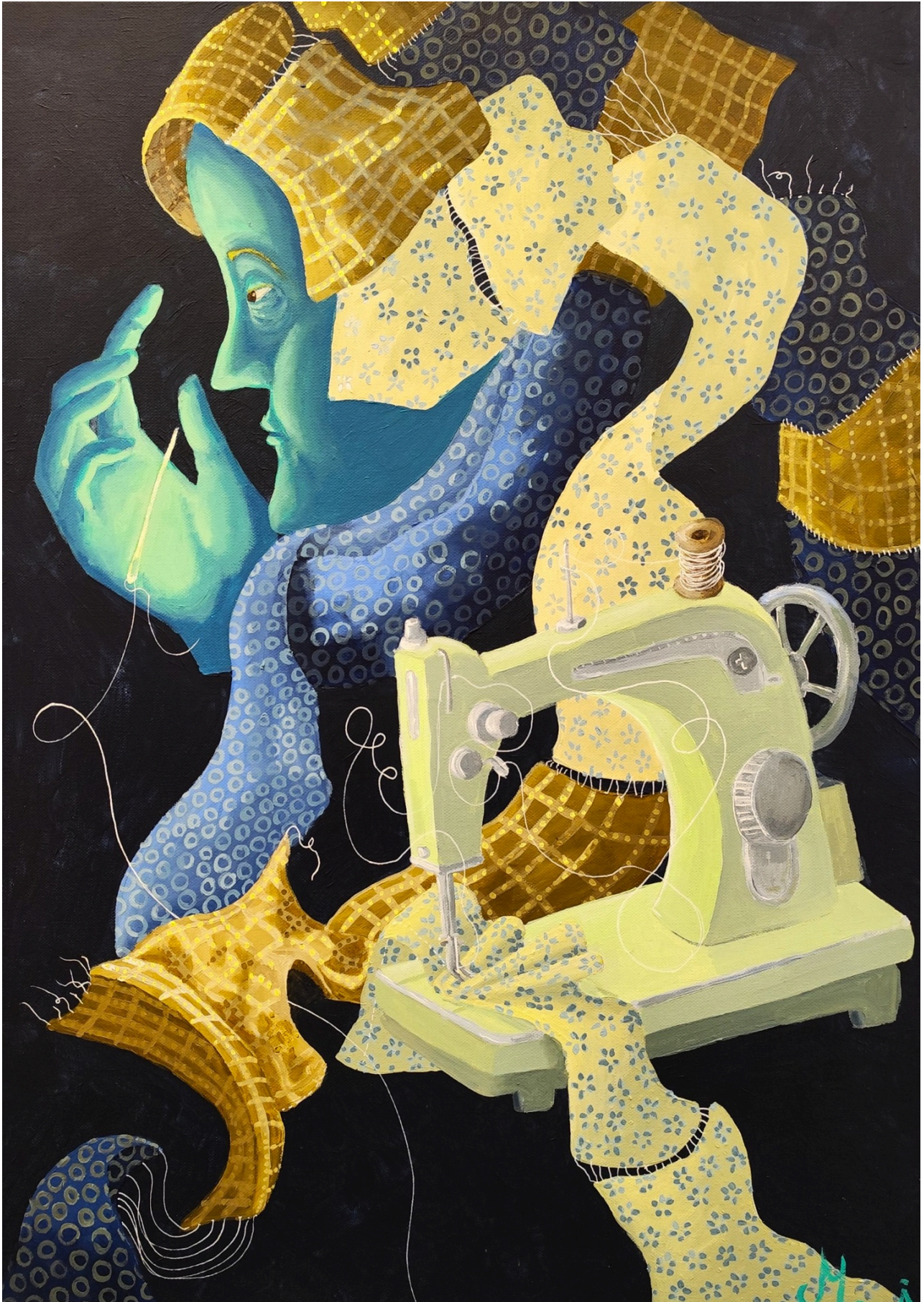
Fil d'Ariane , 2026 Acrylique sur toile, 70 x 50 cm