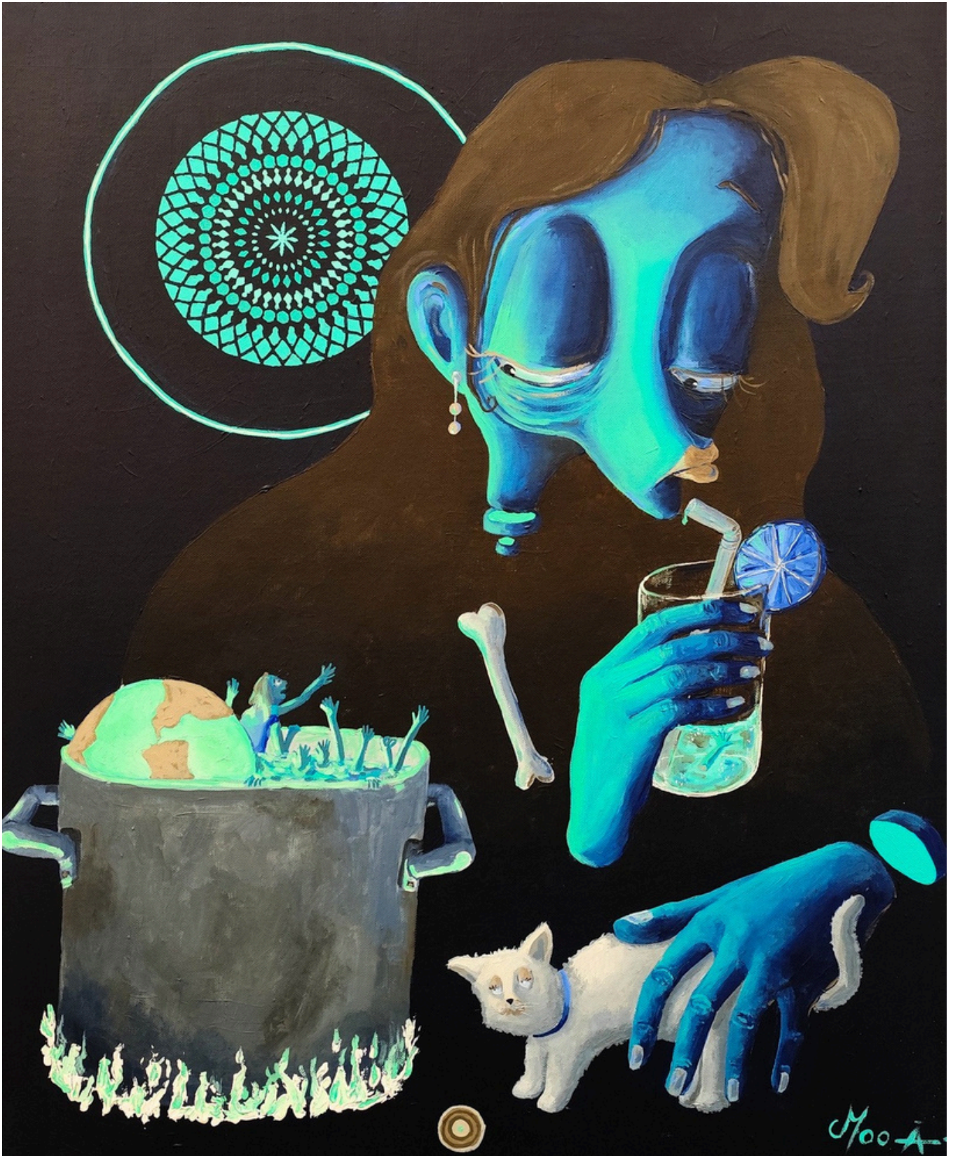
Le goût du mépris, 2025 Acrylique sur toile, 65 x 56 cm