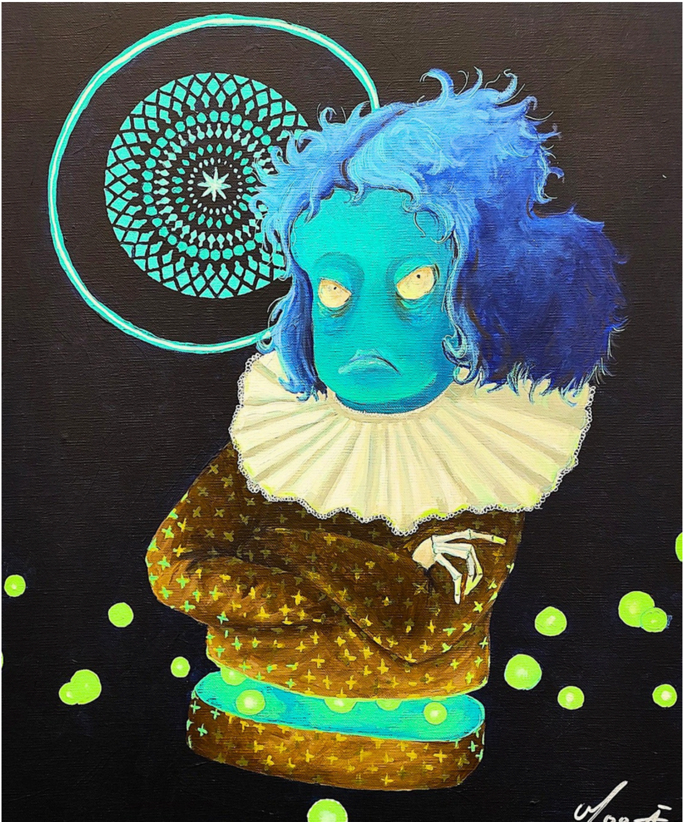
La moue , 2025 Acrylique sur toile, 65 × 56 cm