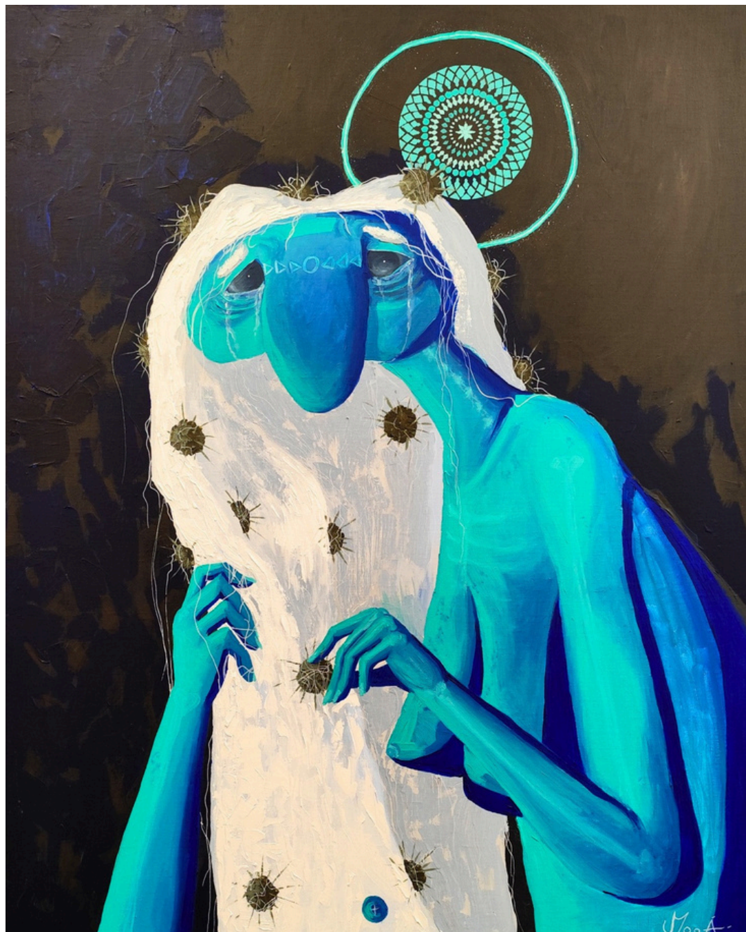
Cheveux de traverses, 2025 Acrylique sur toile, 100 x 80 cm