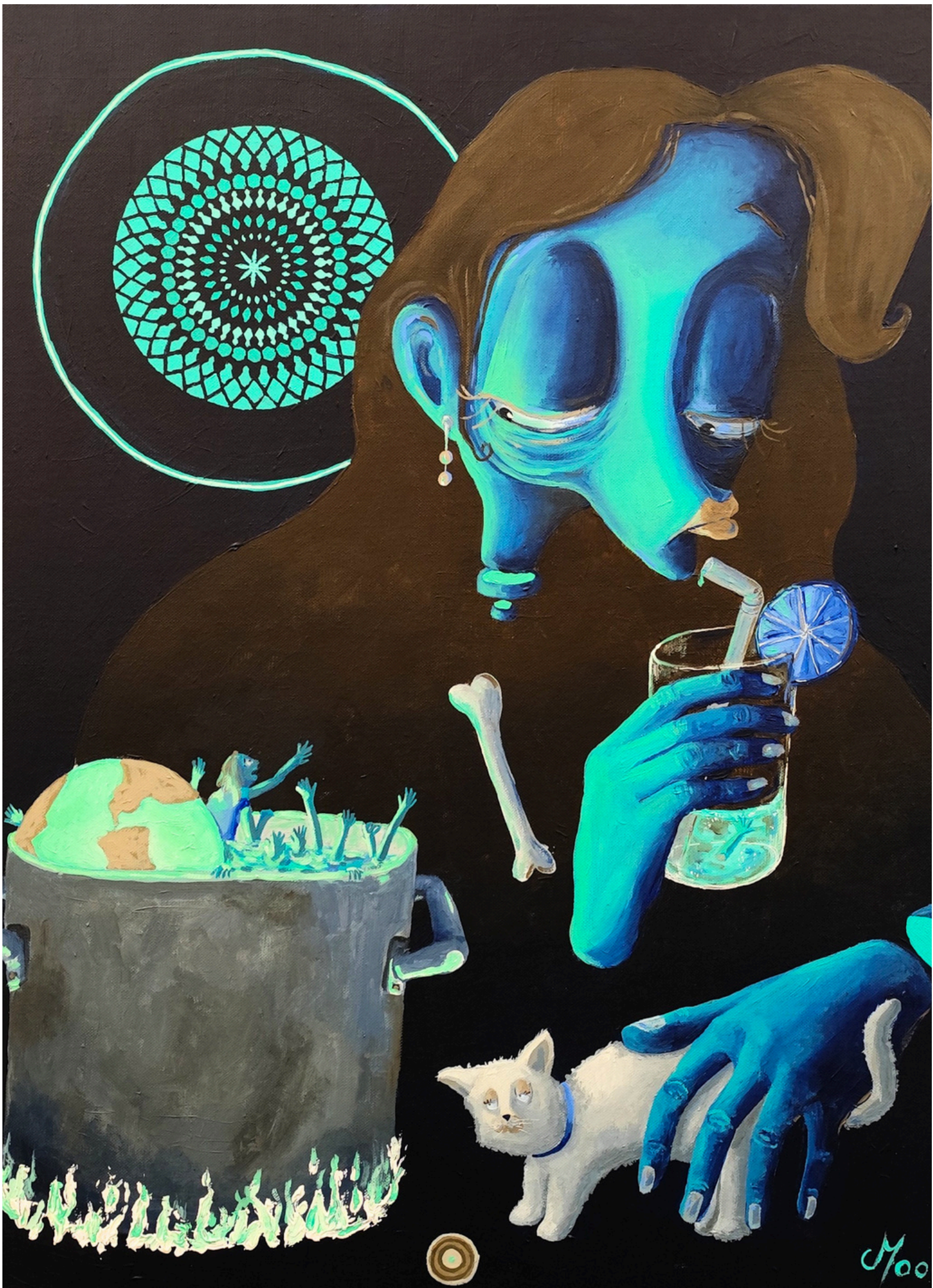
Le goût du mépris, 2025, acrylique sur toile, 65 × 56 cm