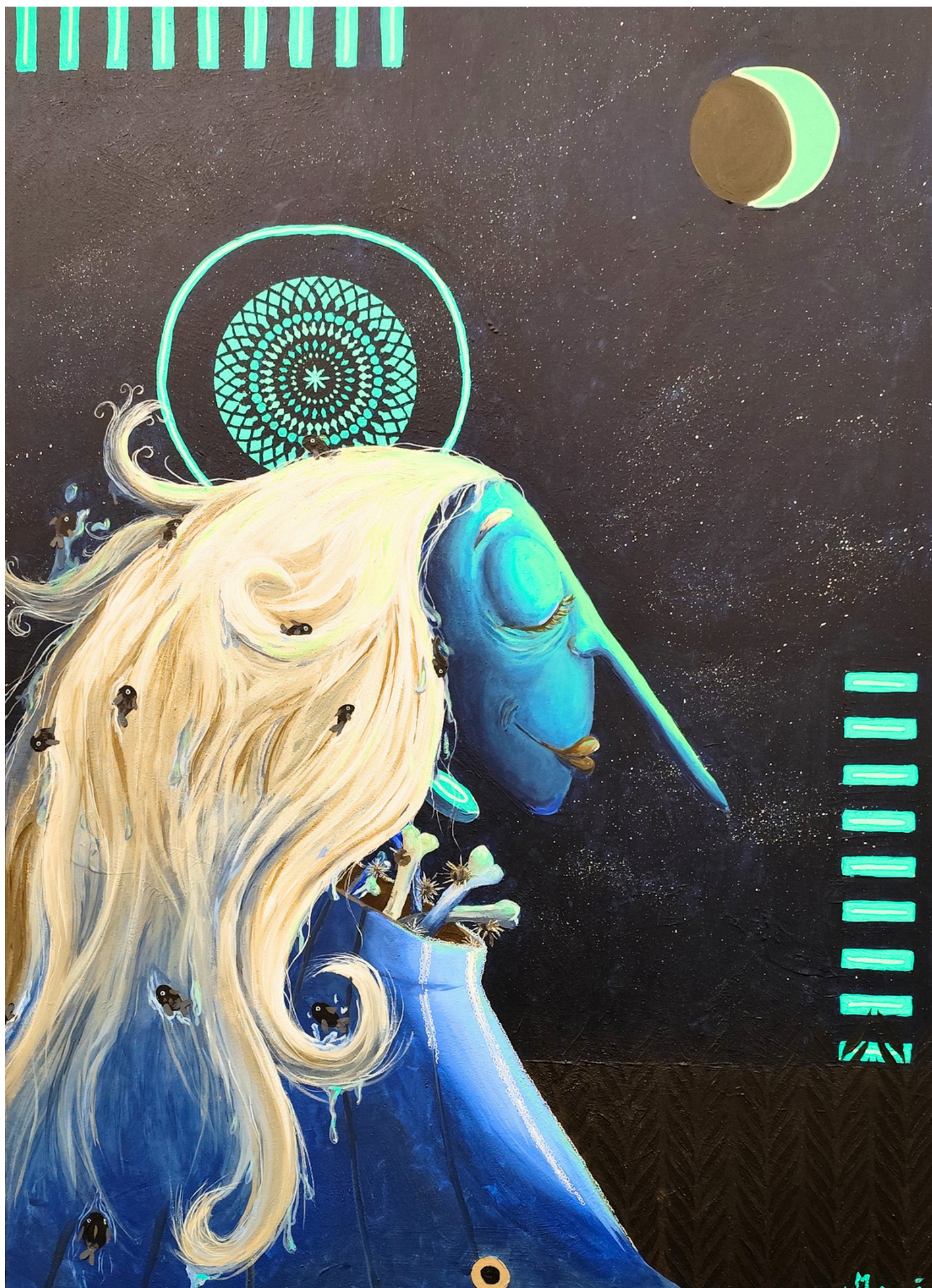
Acceptation lunaire, 2025, acrylique sur toile, 92 x 65 cm