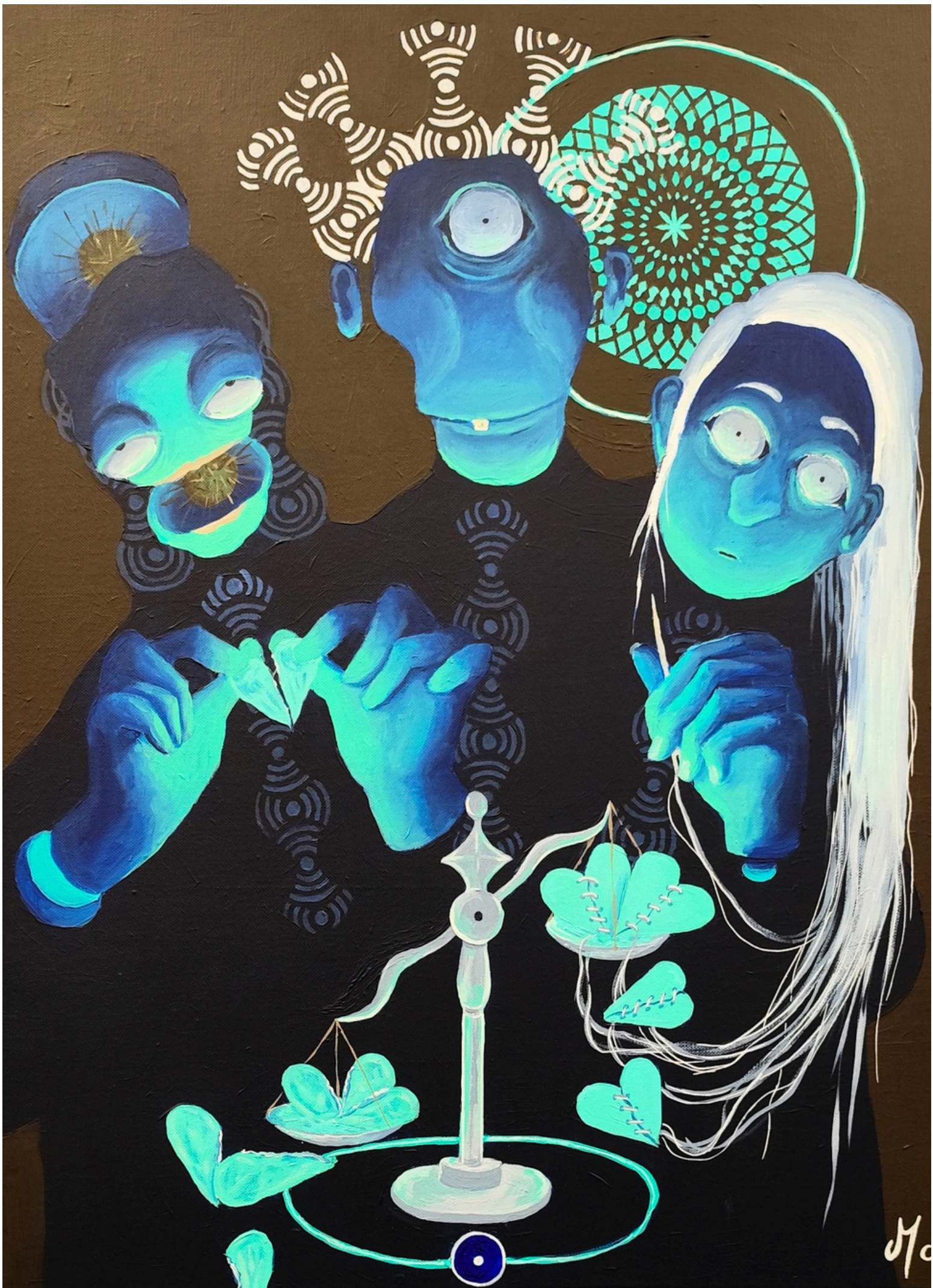
Grandir, 2025, acrylique sur toile, 65 × 56 cm