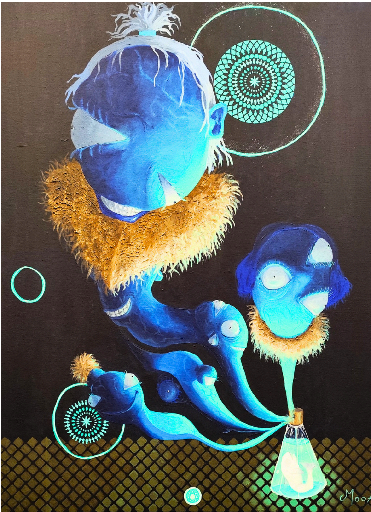
Beauté antérieure, 2025, acrylique sur toile, 65 × 56 cm