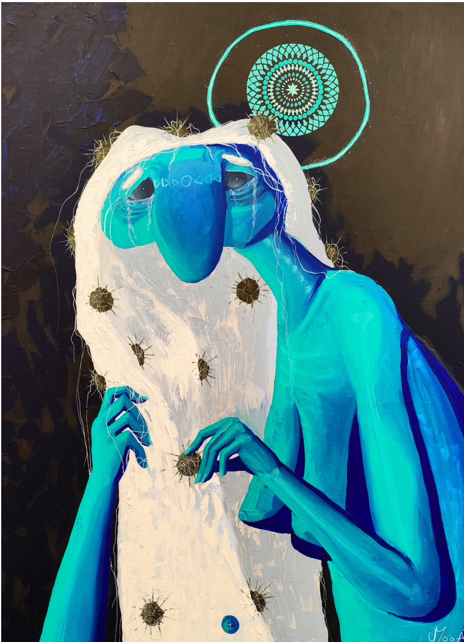
Cheveux de traverses, 2025, acrylique sur toile, 100 × 80 cm