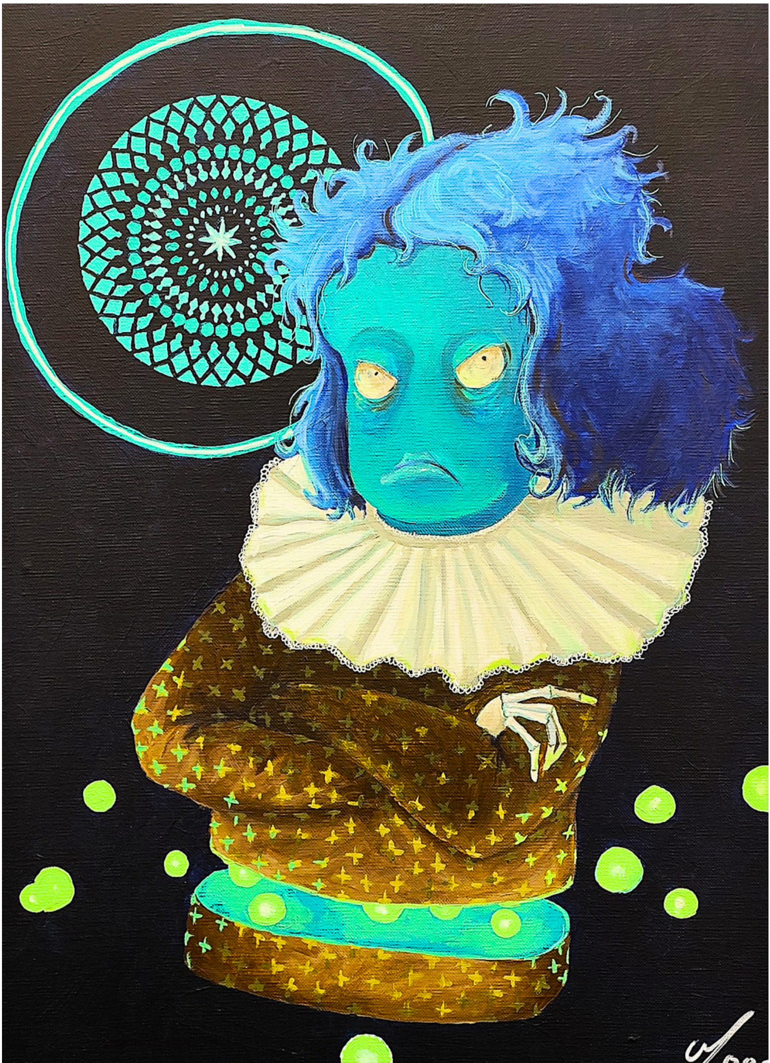
La moue, 2025, acrylique sur toile, 65 x 56 cm